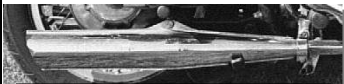
Marmitta per Guzzi v7 disponibile con omologazione

Specializzato in marmitte per moto d'epoca